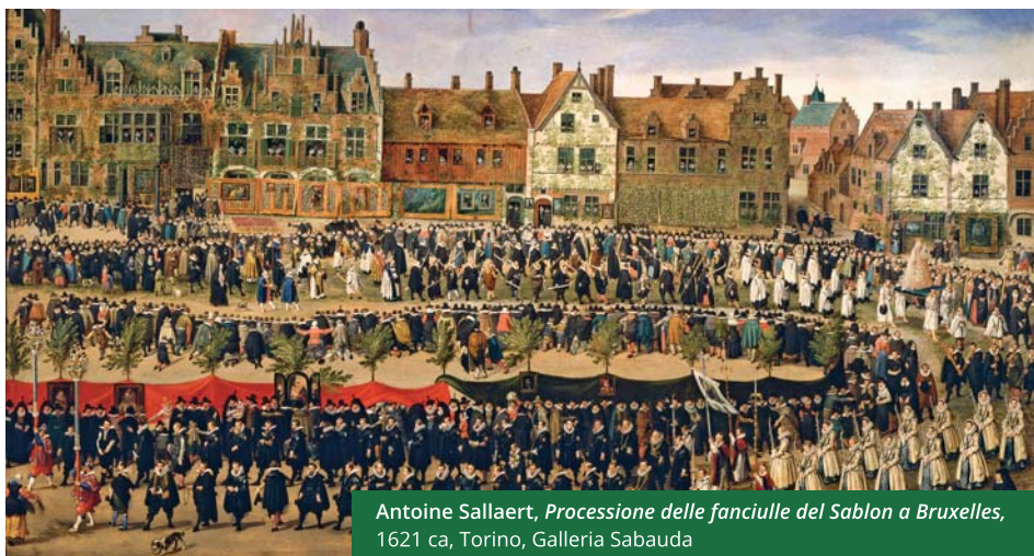
Antoine Sallaert, Processione delle fanciulle del Sablon a Bruxelles , 1621 ca, Torino, Galleria Sabauda

La Fondazione 1563 per l'Arte e la Cultura, ente strumentale della Compagnia di San Paolo, persegue statutariamente la realizzazione di attività di ricerca e di alta formazione nel campo delle discipline umanistiche. In particolare alla Fondazione sono affidate tutela, gestione e valorizzazione dell'Archivio Storico della Compagnia di San Paolo e la promozione di un articolato Programma di studi e ricerche sull'Età e la Cultura del Barocco.