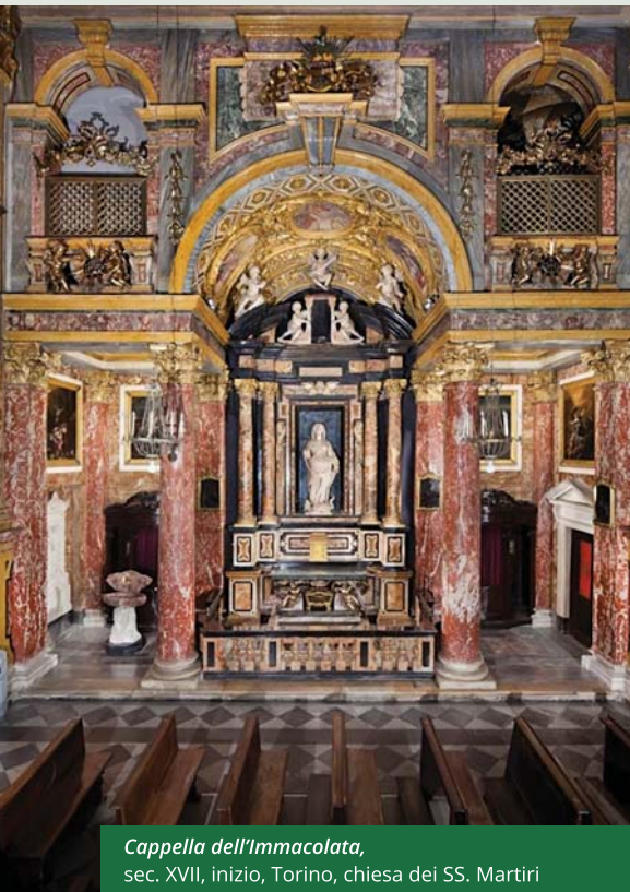
Cappella dell'Immacolata, sec. XVII, inizio, Torino, chiesa dei SS. Martiri